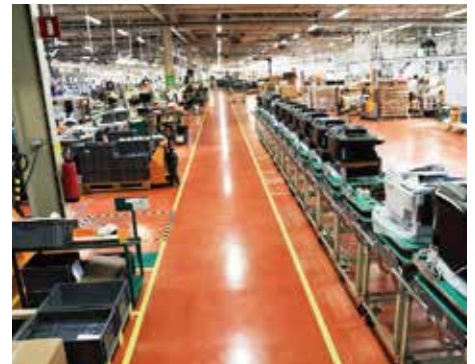
頻繁にレイアウト変更しない区画ライン